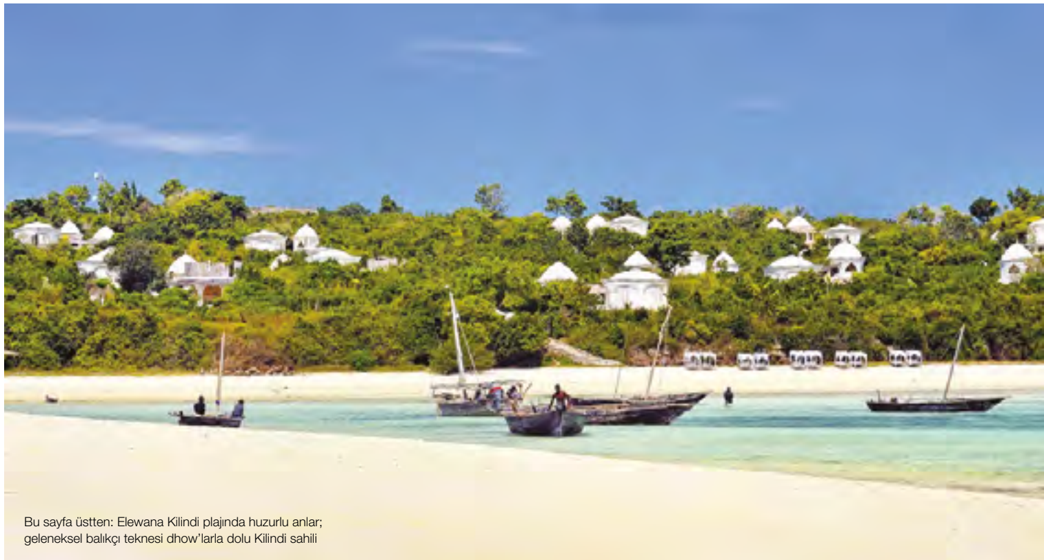
Bu sayfa üstten: Elewana Kilindi plajında huzurlu anlar; geleneksel balıkçı teknesi dhow'larla dolu Kilindi sahili