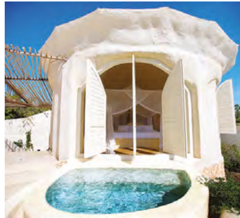
Bu sayfa soldan saat yönünde: Tropikal meyveler kahvaltılığının da vazgeçilmezlerinden; Her oda ana binadan bağımsız özel havuza sahip; Burada oda banyoları ayrı bir binada; Elewana Kilindi pavillon'larından biri

Bazı kelimelerin anlamları zaman içerisinde değişip evrilebiliyor. Mesela lüks... Lüksün tanımı ulaşılması zor olan şeylerin etrafında yapılır. Peki, günümüz için bu nedir? Doğanın içinde olabilmek, ailenizle geçirdiğiniz vakit, kendinize ayıracağınız rahatlama ve içe dönme anları olabilir mi? Günümüz yoğun temposu içerisinde bu tanımladığımız lükse ulaşmak en kolay tatillerde olabiliyor. İşte bu yüzden son yıllarda insanların tatil mekanı seçimindeki kriterler de ziyadesiyle değişti.